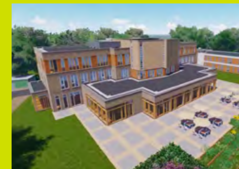
NIEUW HYDEPARK Doorn

Kom met uw gezelschap genieten van een onbezorgde vakantie. Samen met u kijken we naar de periode en inhoud van de vakantie). In veel gevallen heeft u de hele groepslocatie voor uzelf.