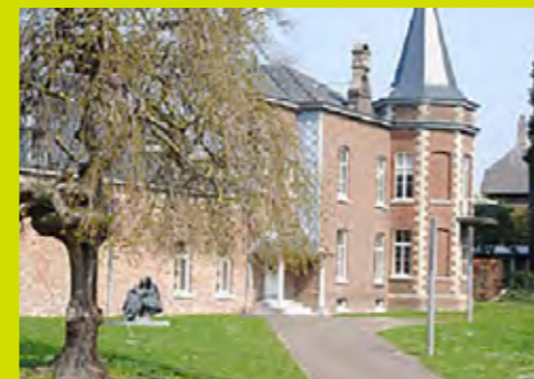
DE HEERENHOF Mechelen (ZL)