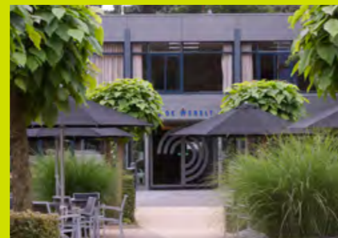
DE WERELT Lunteren